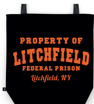
ORANGE IS THE NEW BLACK