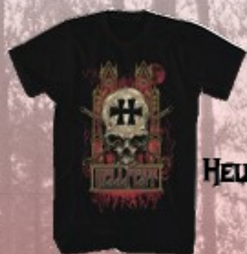
HELLCHURCH - HOMME 20 €