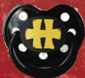
HELL YELLOW TETINE 4 €