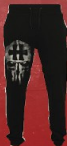
PUNISHHELL 26 €