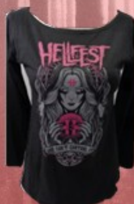
PROPHECY - FEMME 28 €