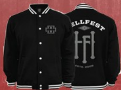
VESTE COLLEGE 49 €