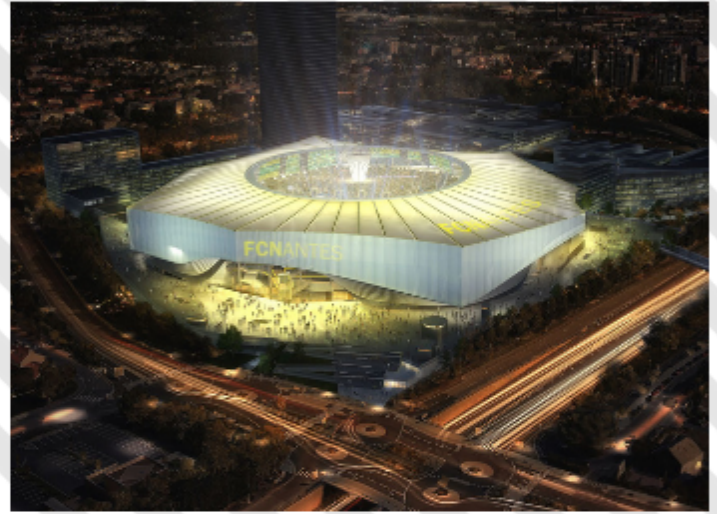
Illustration du stade du Yellopark