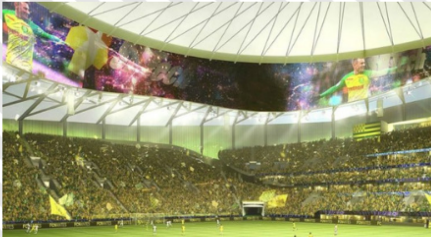
Illustration des tribunes du Yellopark