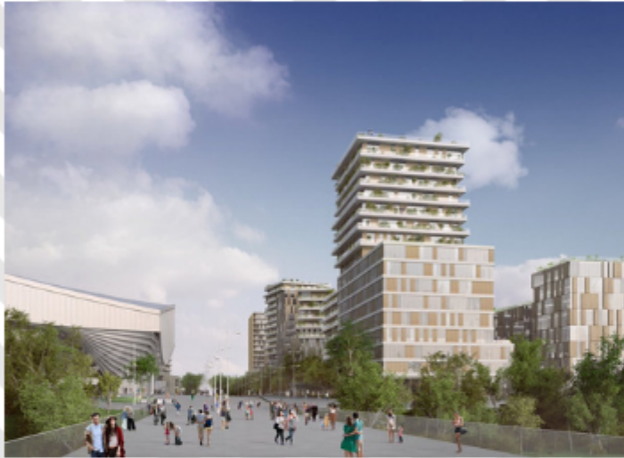
Illustration du quartier Yellopark