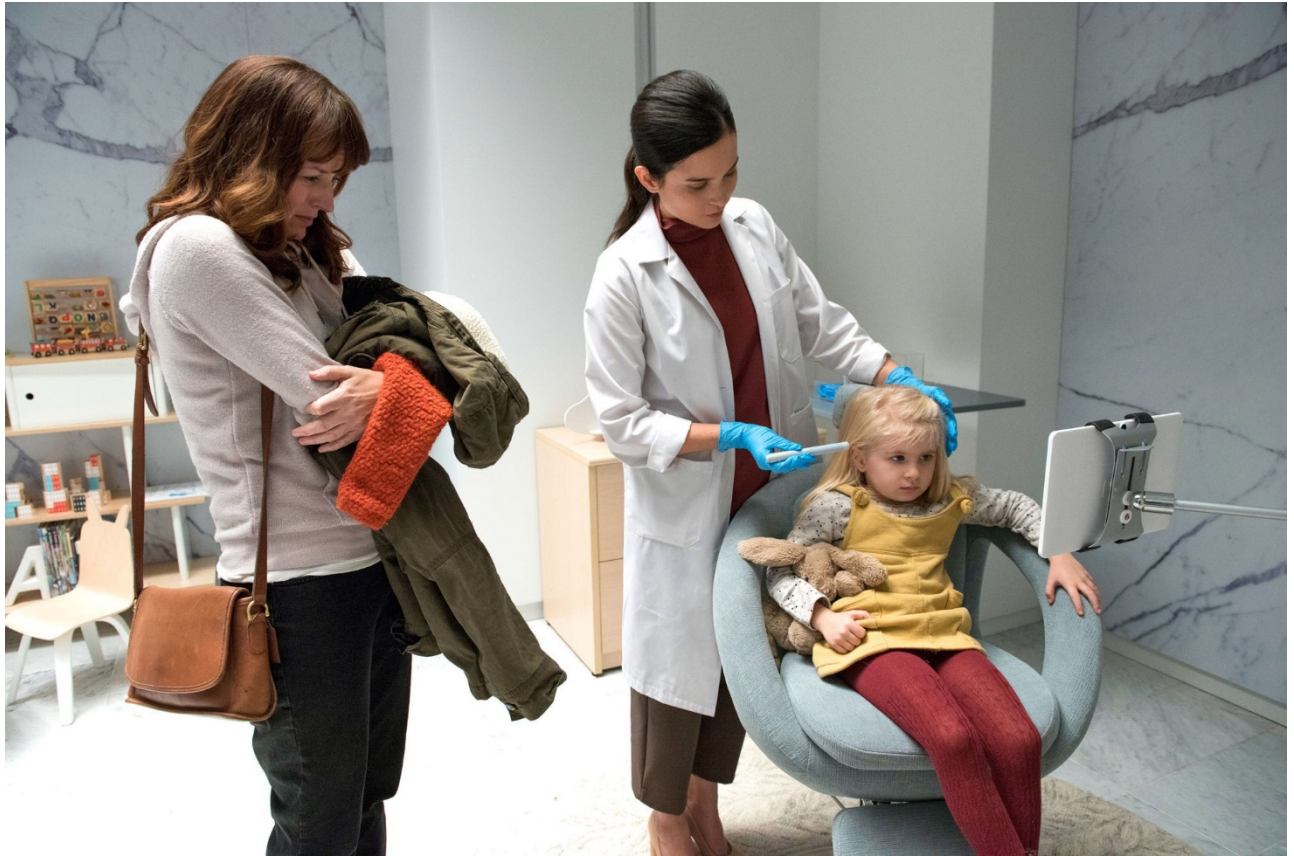
Extrait du teaser de l'épisode "Arkangel" réalisé par Jodie Foster : On observe une mère accompagnant sa fille pendant une observation médicale.

http://ew.com/tv/2017/10/11/black-mirror-season-4/