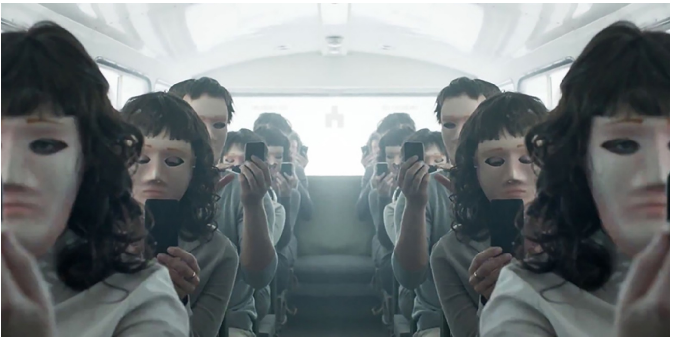
Extrait du Trailer paru en Août mis en ligne par Netflix sur Youtube. On observe une multitude de visage absorbé par leurs smartphones.

http://ew.com/tv/2017/10/11/black-mirror-season-4/