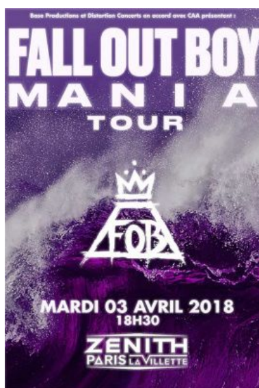
« Fall out Boy sera en concert le 03 avril 2018 au Zénith de Paris. »