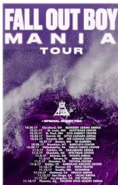
« Affiche de la tournée de Fall out Boy pour son album Mania. »